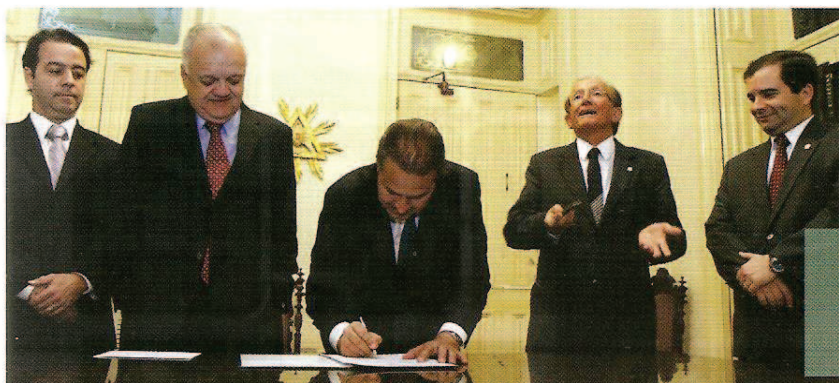
Governador Eduardo Campos autoriza atualização do repasse da subvenção à CAMPE